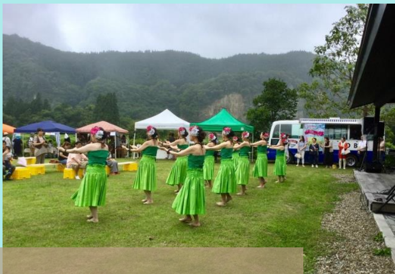
骨寺村荘園交流館の中庭で披露されたフラダンス